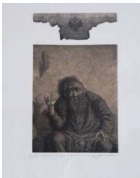
Рисунок 4. Офорт. Б.Л. Непомнящий. Иллюстрация к повести Ф.М. Достоевского «Записки из Мертвого дома». 2012. Особое приложение к изданию Ф.М. Достоевского «Записки из Мертвого дома». СПб.: «Вита Нова», 2011.