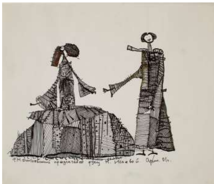
Рисунок 3. Графическая работа. А.С. Архиповский. «Ф.М. Достоевский предлагает руку Исаевой». Из серии «Достоевский в Кузнецке». 2001. Новокузнецк.